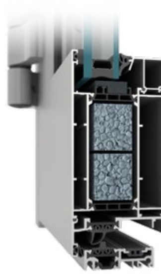
drzwi MB-79N SI+''